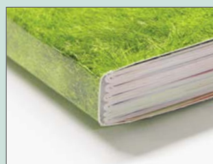
Brossura filo refe